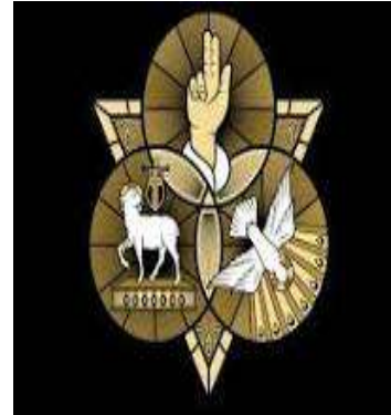
La Sainte Trinité Père, Fils, Esprit